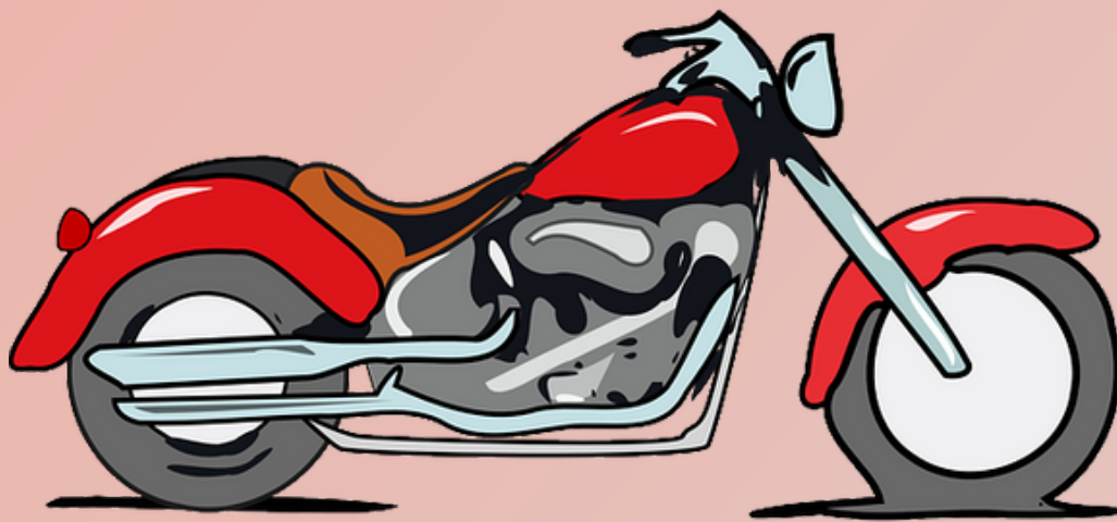
Motor Gede diatas 400 CC